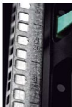
Unidades rack numeradas en todos los perfiles