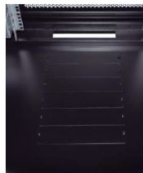
Entrada de cables por suelo de gran capacidad con tapas modulares atornilladas