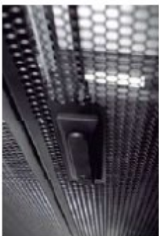
Área ventilación trasera